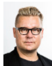
asiantuntijaopas Katainen Pekka